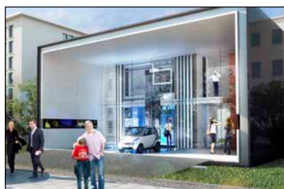
Bild 2: Das Effizienzhaus-Plus mit Elektromobilität in Berlin

Doch ein Jahr danach verging allen Beteiligten das Lachen. Das Ergebnis war nämlich vernichtend. Die Luft-Wärmepumpe kam auf eine Jahresarbeitszahl von nur JAZ = 2,3 (Planzahl: 3,5) und war damit noch um 0,5 JAZ-Punkte schlechter als das Mittel, das die Loka-